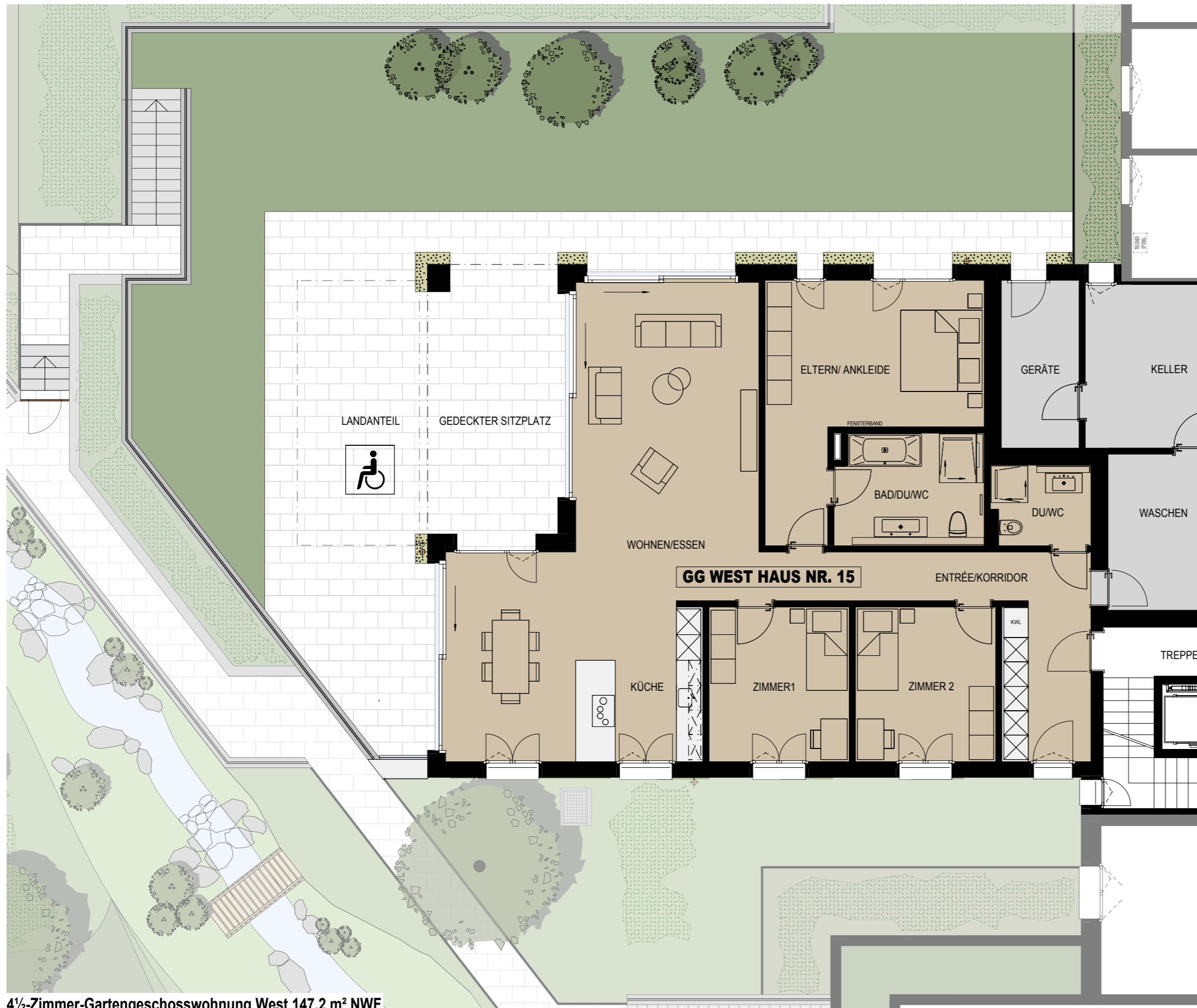
4 1/2-Zimmer-Gartengeschosswohnung West 147.2 m² NWF