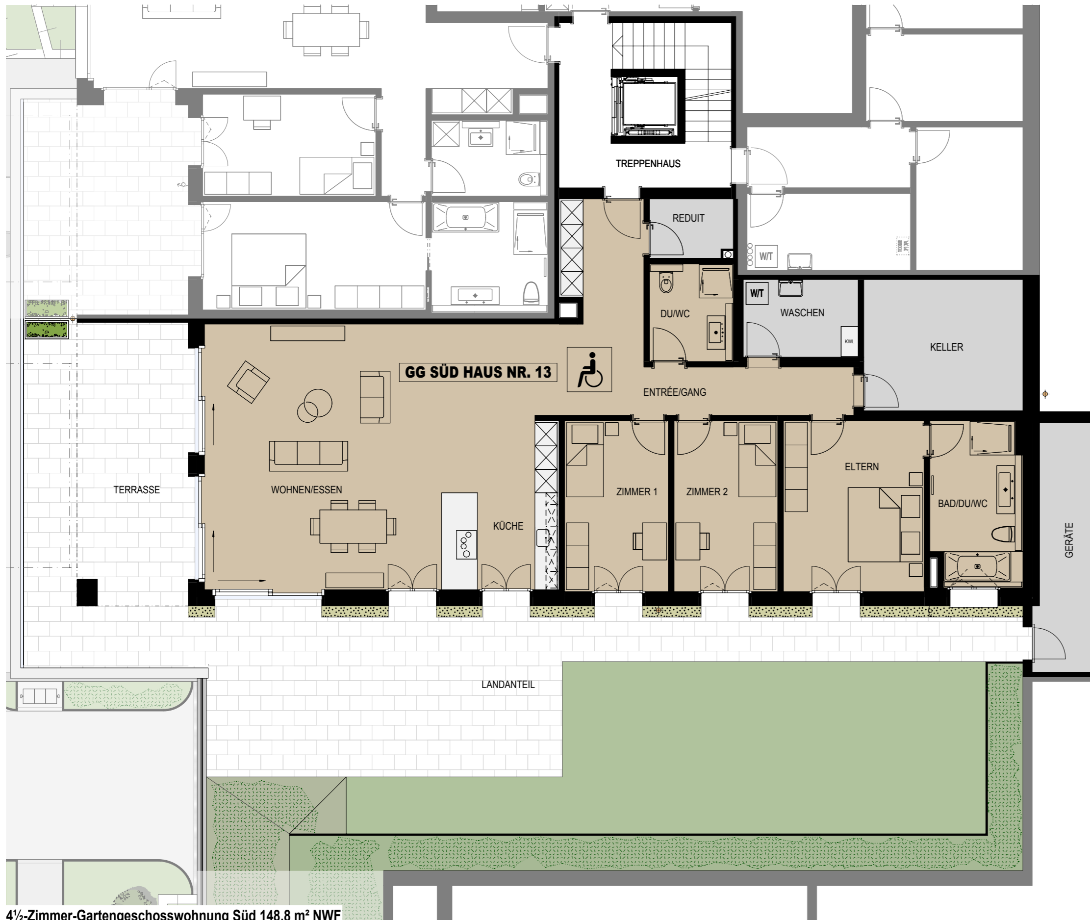
4½-Zimmer-Gartengeschosswohnung Süd 148.8 m² NWF