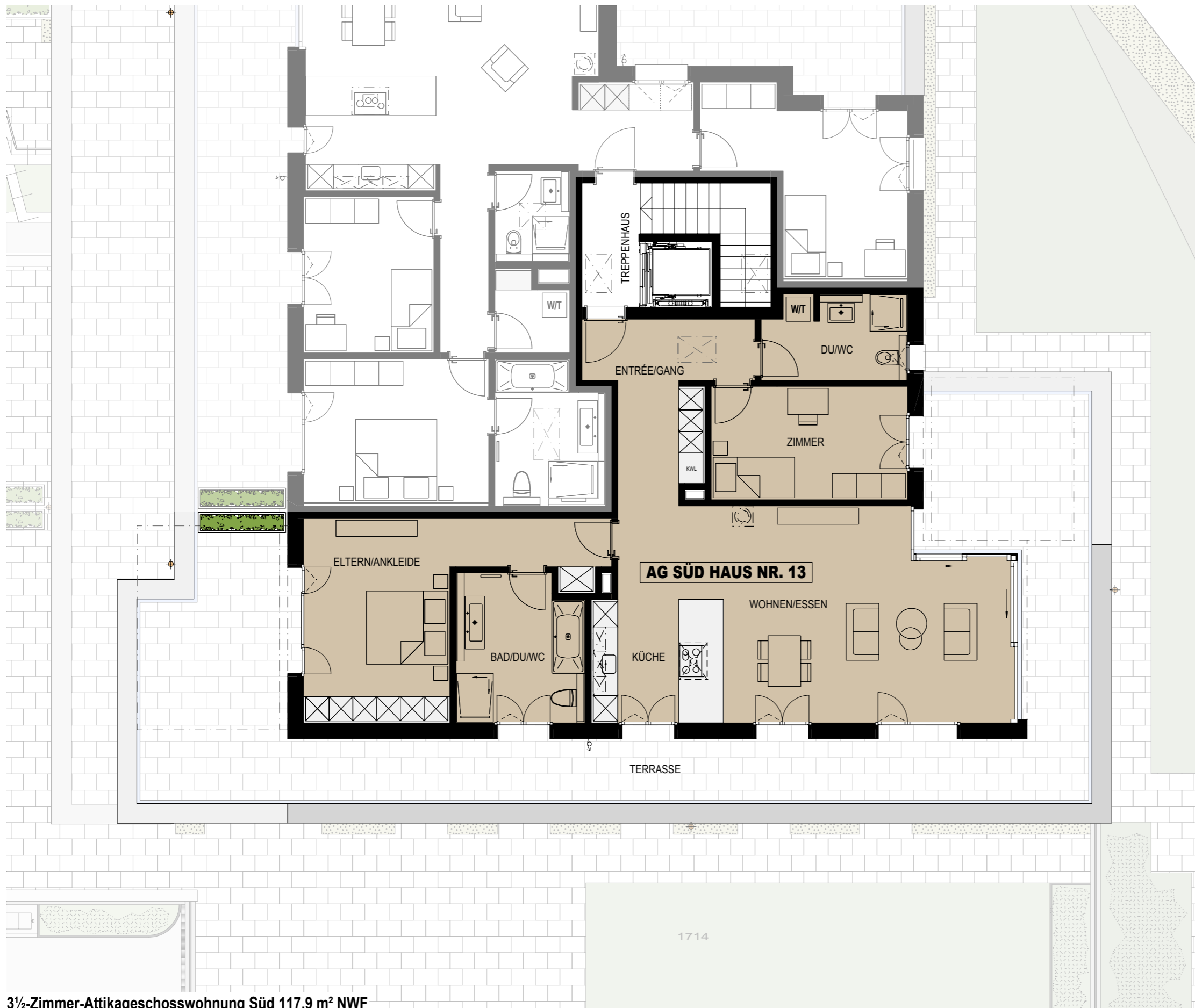
3½-Zimmer-Attikageschosswohnung Süd 117.9 m² NWF