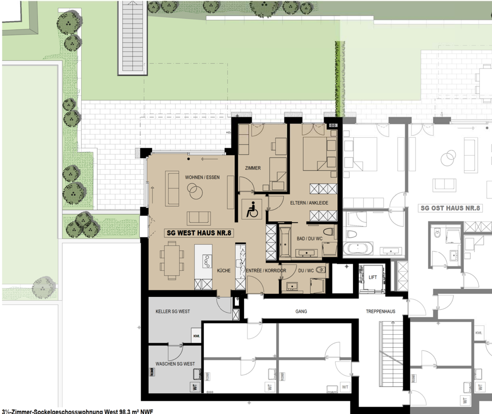
3 1/2-Zimmer-Sockelgeschosswohnung West 98.3 m² NWF