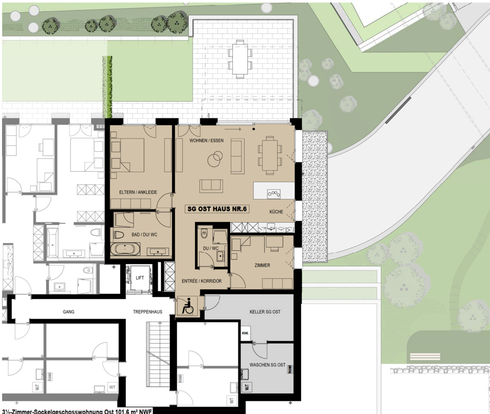
3 1/2-Zimmer-Sockelgeschosswohnung Ost 101.6 m² NWF