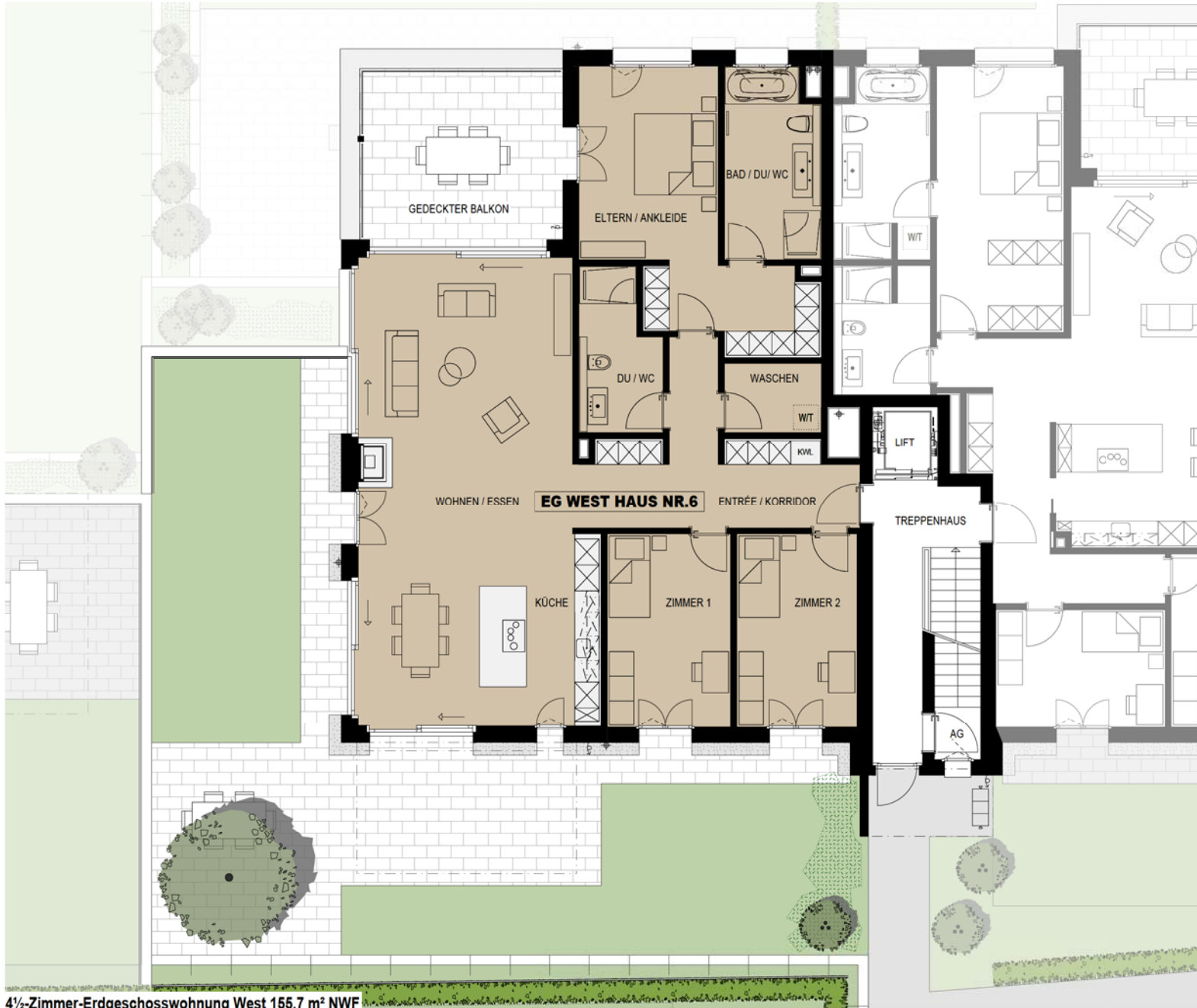
4½-Zimmer-Erdgeschosswohnung West 155.7 m² NWF