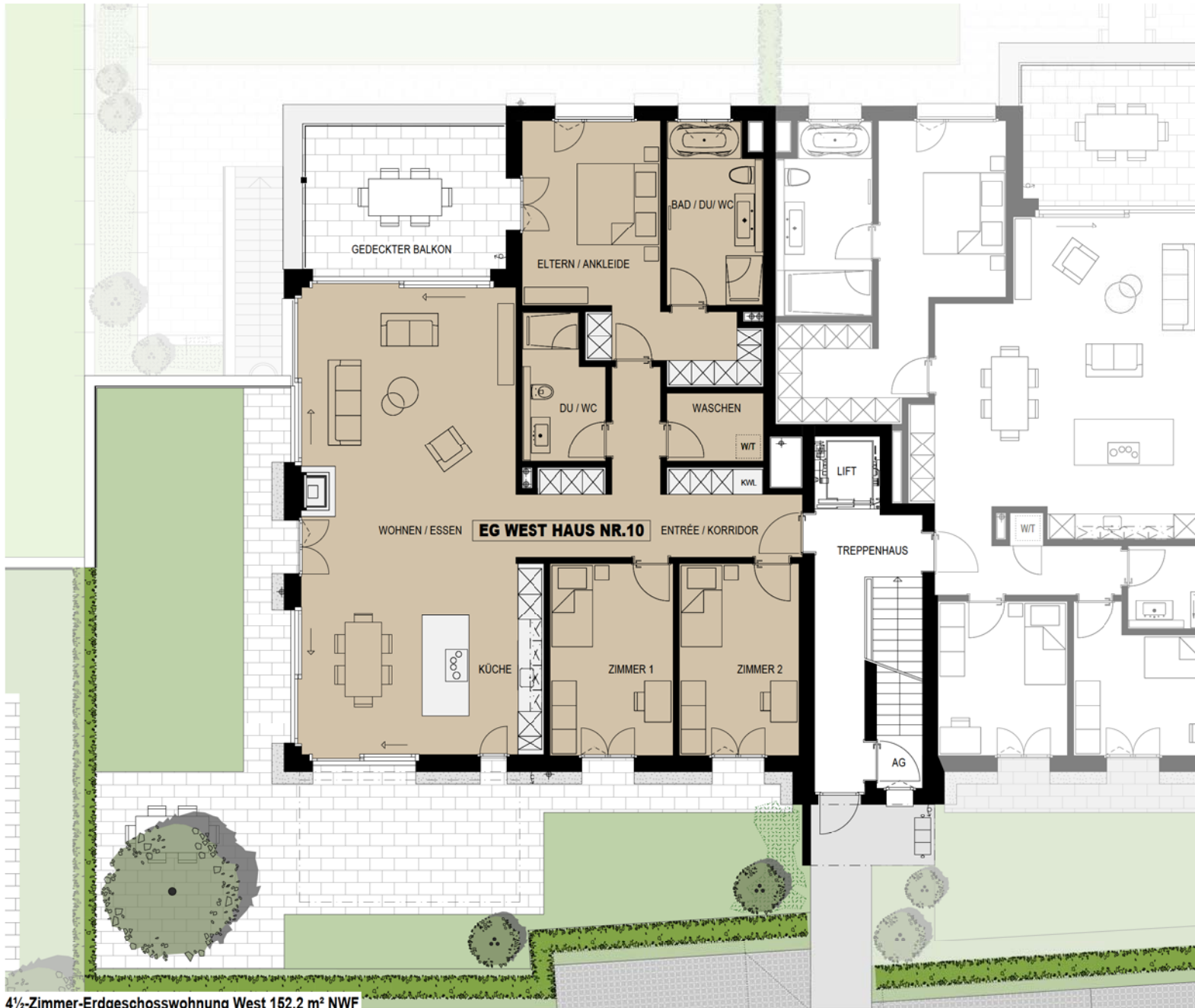
4 1/2-Zimmer-Erdgeschosswohnung West 152.2 m² NWF