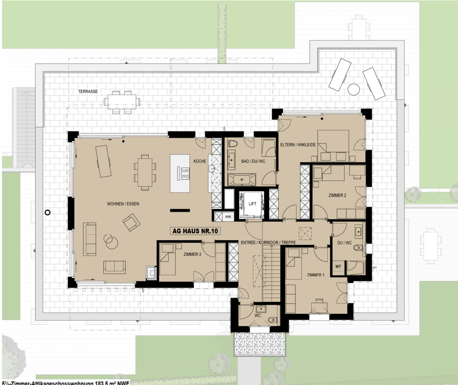
5 1/2-Zimmer-Attikageschosswohnung 183.5 m² NWF