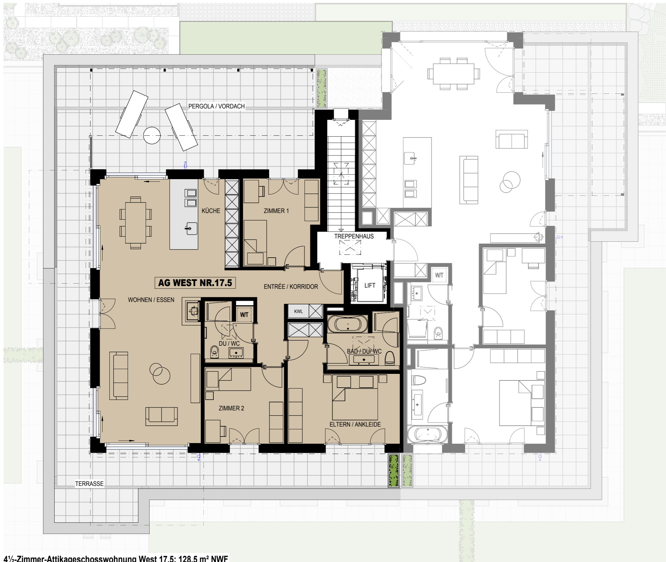
4 1/2-Zimmer-Attikageschosswohnung West 17.5; 128.5 m² NWF